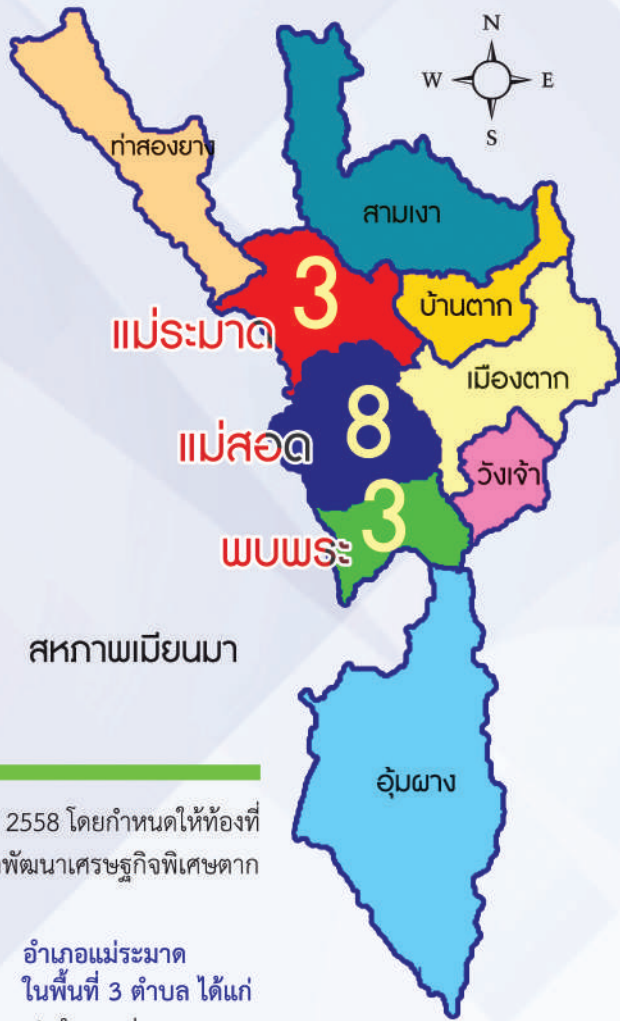
สหภาพเมียนมา